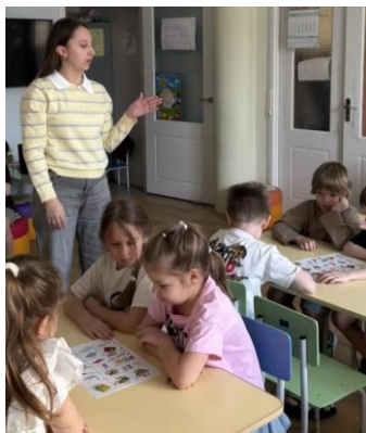
Установочная инструкция перед занятием