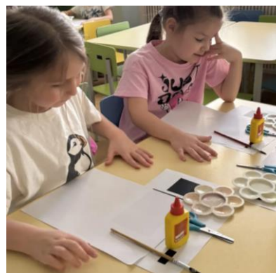
Раскладывание материала для проведения занятия