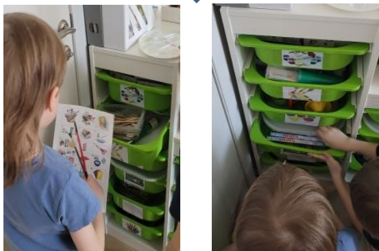
Подготовка раздаточного материала