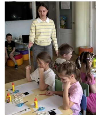
Проверка подготовленного рабочего места